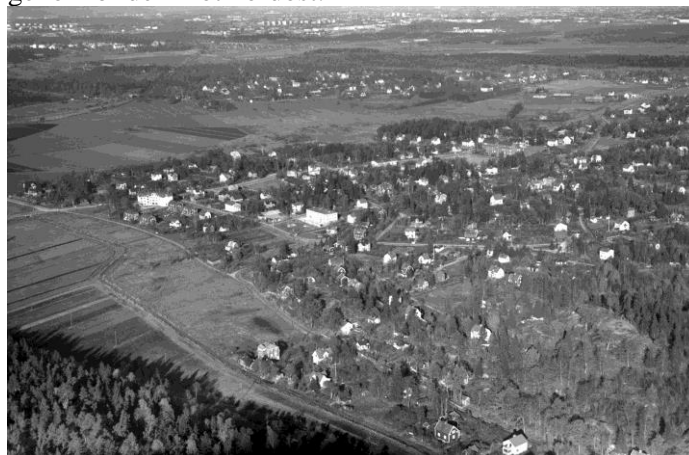
Fotograd Oscar Bladh 1936

Flygbild norrut över Örby, Liseberg, Västberga och Midsommarkransen. I bilden övre kant skimtar Liljeholmen och Södermalm med bland annat Årstabron. Huddingevägen syns diagonalt genom bilden mot nordost.