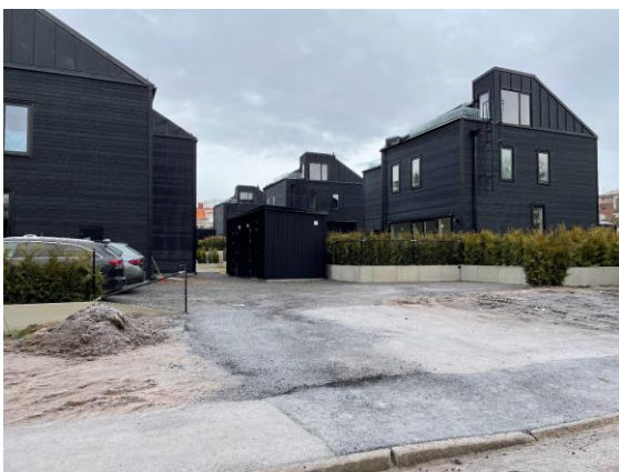
Sex hus trängs på Smedjans gamla tomt vid Sparreholmsvägen. Säkert bra bostäder, men inte ett enda träd sparades och det finns ingen plats för träd med den planen.

Stockholms stad antog under förra mandatperioden 2021 en strategi för villasträdgårdsstäderna runt Stockholm: Varsam utveckling av småhus- och villaområden – strategi med vägledningar. En viktig tanke med vägledningen var att skydda områdenas kulturhistoria, karaktär och grönska mot oplanerad förtätning. Men trycket på förtätning finns där hela tiden i olika former alltifrån viljan att ordna trevliga lekplatser till att bygga hus, vägar och parkeringar, för att inte tala om infrastruktur. Det leder till att alltfler träd försvinner som till exempel den hårda exploateringen av gamla smedjan vid Sparreholmsvägen.