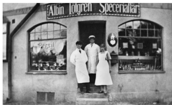
Löfgrens Speceriaffär i Leipzighuset.