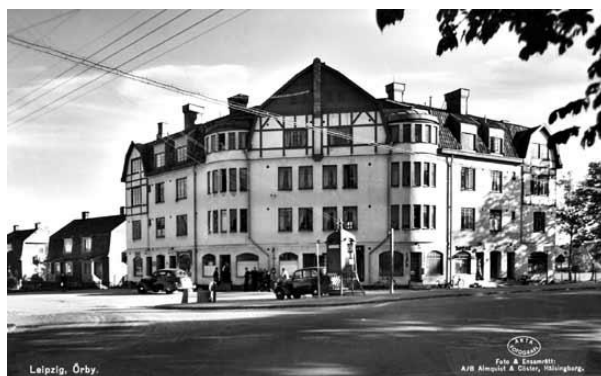
Leipzighuset 1915. Korsningen Turingevägen - (G:a) Huddingevägen.