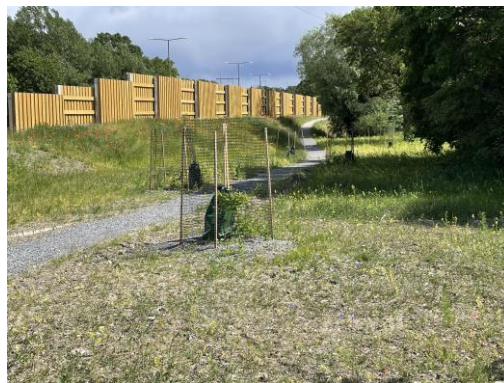
Den nya gångstigen längs Örbyleden.

Till höstloppisen var det 53 hushåll som ställde ut prylar till försäljning på sina gårdar. Vädret var fint med sol på förmiddagen och molnigt efter lunch. Det var mycket folk i rörelse i området. Denna gång fick vi upp affischer på områdets informationstavlor och även i grannområdena.